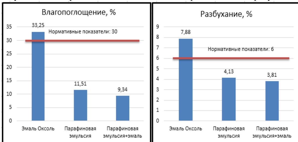
Рис. 2. Результат исследований влияния различных лакокрасочных материалов на величину влагопоглощения и разбухания

Область варьирования количества вводимой парафиновой эмульсии составила от 10 до 50 %. Введение парафиновой эмульсии от 10 до 40 % не давало ощутимых результатов по влагопоглощению и разбуханию. Введение более 50 % приводило к тому, что увеличивалось время сушки лакокрасочной композиции. Отверждение было достигнуто при смешивании парафиновой эмульсии и эмали соотношением 50/50 %. Результаты экспериментальных исследований представлены на рисунке 2.